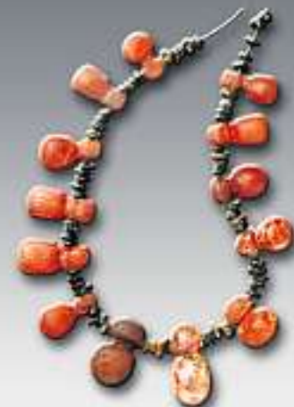
FEIN GEMACHT: Mit bunten Ketten schmückten sich Thüringer Frauen gern.