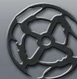
DEUTUNGEN: Sowohl christlich als auch heidnisch könnte die Zierscheibe aus Kölleda sein.