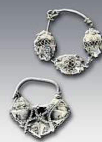
AUS DEM OSTEN: Slawische Beerenohrringe aus dem Saale-Orla- und dem Landkreis Sömmerda.