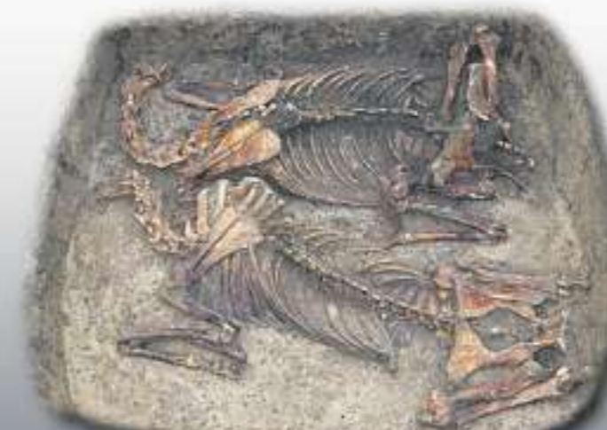
KOPFLOSE PFERDE: Zwei rituell begrabene Pferde, die in Sondershausen ausgegraben wurden, zeugen von heidnischen Sitten.