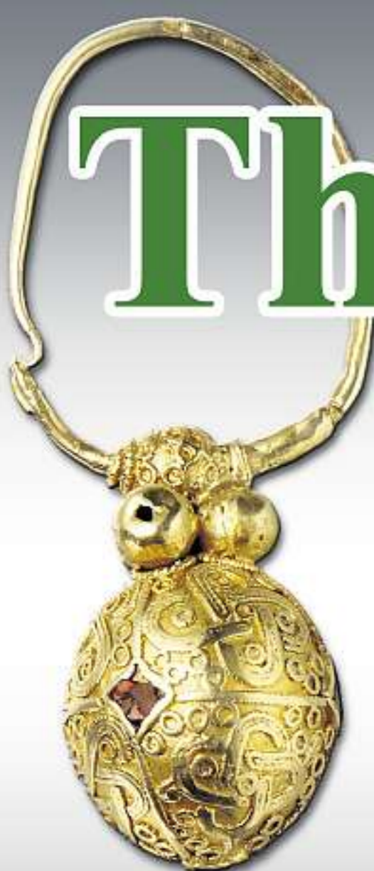
STATUSSYMBOL: Dieser Bommelohrring gehörte um 700 einer Adligen in Sondershausen.

Gut möglich, dass die stürmischen Zeiten zu Abwanderungsbewegungen und einer Ausdünnung der Bevölkerung geführt haben, die besonders für Ostthüringen vermutet wird. Zum Teil wird diese Entwicklung jedoch durch den Zuzug von Slawen aus dem Osten neutralisiert, die im 7. Jahrhundert einsetzt und offenbar zumeist friedlich abläuft. Schließlich hatte Radulf, nachdem er die Macht in Thüringen übernommen hatte, Freundschaftsverträge mit den östlichen Nachbarn abgeschlossen. Die Slawen, die durch besonderen Schmuck und spezifische Keramik erfasst werden können, assimilierten sich zumeist nach wenigen Generationen.