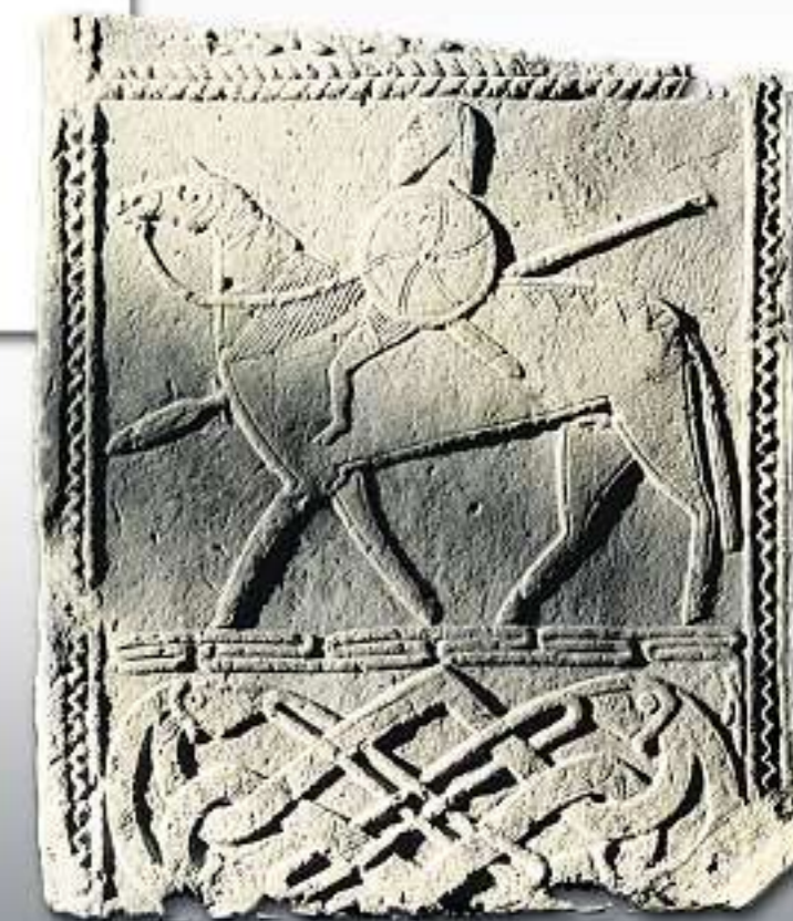
REITERSTEIN: In Hornhausen (Sachsen-Anhalt) entdeckt, bildete der Stein einst die Brüstung in einer Kirche des 7. Jahrhunderts.