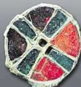
KREUZSYMBOL: Diese Fibel aus dem 9. Jahrhundert stammt aus dem Landkreis Bernburg.