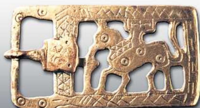
SCHILDDORSNSCHNALLE: Einem wohlhabenden Krieger aus Weimar gehörte dieser Teil einer Gürtelgarnitur aus dem 7. Jahrhundert.