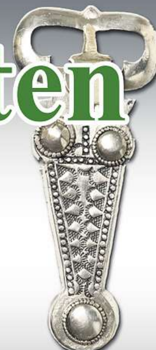
AUS DEM WESTEN: Fränkischen Einfluss zeigt die silberne Gürtelschnalle aus Alach.