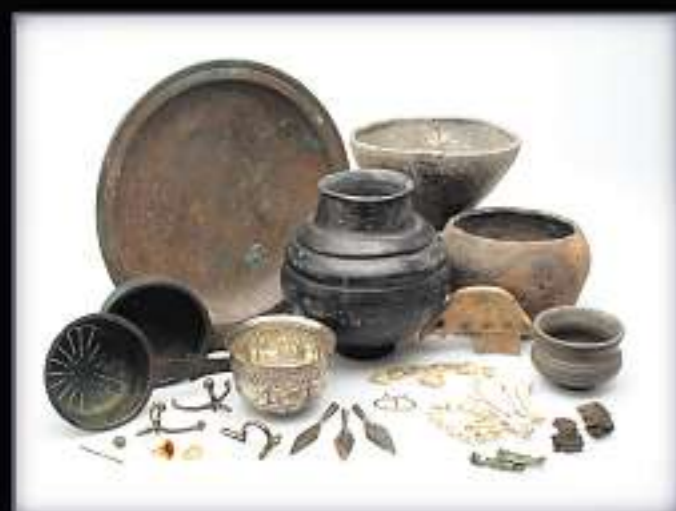
FÜRSTENGRAB: Ähnlich reich wie das Grab in Haßleben ist das Fürstengrab von Leuna ausgestattet, das im Landesmuseum für Vorgeschichte in Halle bewundert werden kann.