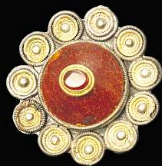
SCHMUCK: Tutulusfibel aus dem Fürstengrab von Haßleben. Bis 11. Januar ist sie in der Ausstellung „Rom und die Barbaren“ der Kunst- und Ausstellungshalle Bonn, dann wieder in Weimar zu sehen.