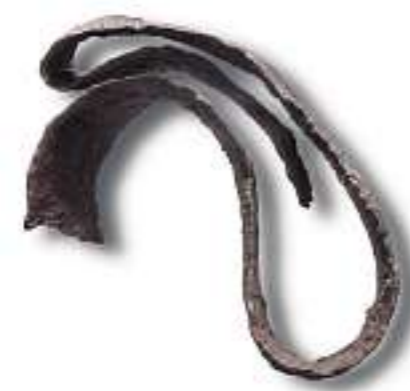
WAFFEN: Ritual zweischneidiges Schwert aus einem Brandgrab in Mühlhausen.

Wenn im Rom zur frühen Kaiserzeit das Wort Germanen fiel, rümpften die feinen Herren und Damen ihre Nasen. Das weite Land jenseits der Reichsgrenzen eignete sich bestenfalls für Schauer geschichten. In den undurchdringlichen Urwäldern und rings um die stinkenden Moore hausten ungezähmte Wilde ohne Sitten, die Felle trugen und mit lautem Geschrei jeden Fremden attackierten. Und war kein Fremder in der Nähe, bekämpften sie eben einander.