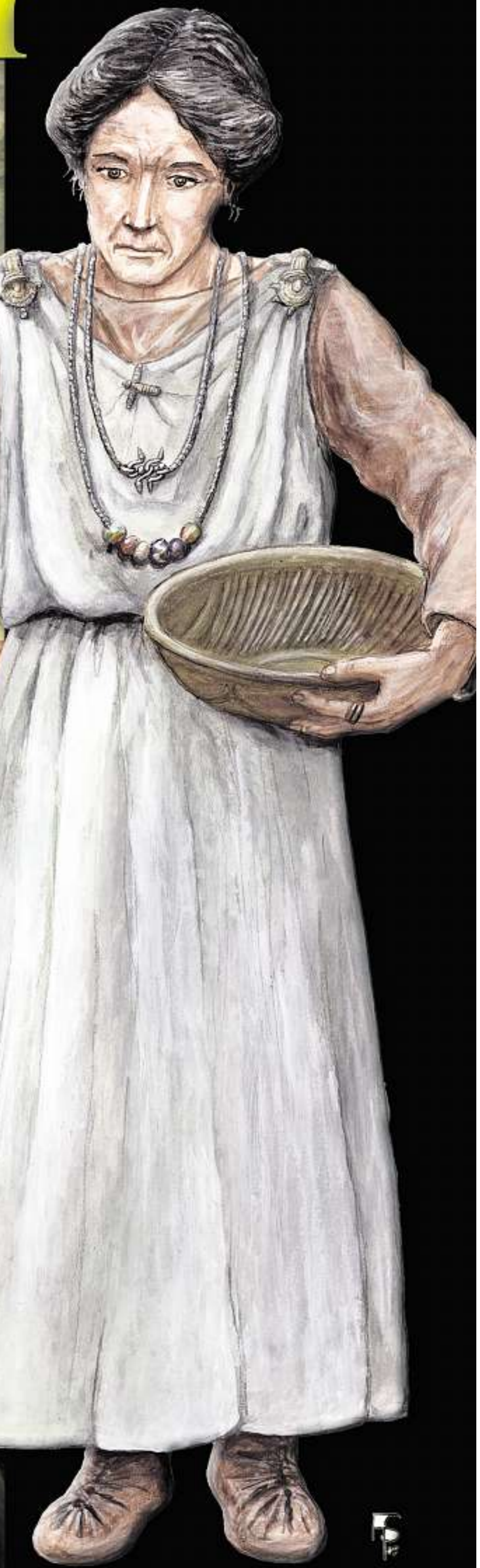
EINGEWANDERT: Das reichste bekannte Thüringer Frauengrab aus dem späten 2. Jahrhundert stammt aus Altengottern (Unstrut-Hainich-Kreis) und wurde 2003 entdeckt. Die zugewanderte Langobardin wurde verbrannt und mit Beigaben in einem Bronzebecken beigesetzt. Die Rekonstruktion von F. Spangenberg ist bis 11. Januar in der Ausstellung „Die Langobarden. Das Ende der Völkerwanderung“ im LVR-Landesmuseum Bonn zu sehen.

Von wem stammen wir ab? Die Wurzeln der heutigen Thüringer lassen sich bis vor die Zeitenwende zurückverfolgen. Unsere dreiteilige Serie geht ihnen nach und beleuchtet die Entwicklung Thüringens von der Germanenzeit bis ins Mittelalter.