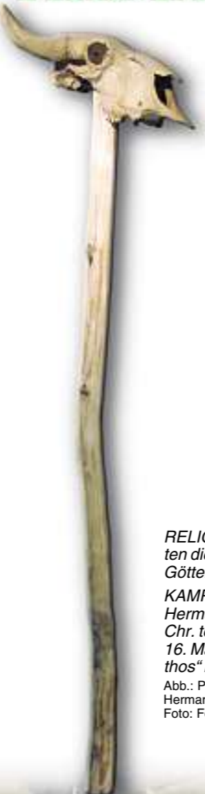
RELIGIÖS: Im Opfermoor von Oberdorla huldigten die Ur-Thüringer auch mit Tieropfern ihren Göttern (links). KAMPFBEREIT: Möglicherweise nahmen einige Hermunduren an der Varusschlacht im Jahr 9. n. Chr. teil (oben). Dem Jubiläum widmet sich ab 18. Mai das Projekt „Imperium – Konflikt – Mythos“ in Haltern am See, Kalkriese und Detmold. Abb.: Peter Janssen d. Ä., Der siegreich vordringende Hermann, 1870-73; Kunstmuseum Krefeld

Trinkgefäße, Münzen und Waffen. Und dieses gute Verhältnis zu Rom ist es vor allem, was die Hermunduren von anderen Germanen unterscheidet. Wer aber waren sie und wo kamen sie her? Die Ursprünge liegen im Dunkeln. Mit der rituellen Niederlegung der Himmelscheibe von Nebra war um 1600 v. Chr. eine erste mitteldeutsche Hochkultur zu Ende gegangen, zu der auch der Fürst von Leubingen gehörte. Danach wurde es aus heutiger Sicht ruhig in Thüringen, bis einige Jahrhunderte v. Chr. sich eine Kultur herauszubilden begann, die ohne einschneidende Brüche bis zu den Hermunduren der Germanenzeit verfolgt werden kann. Ein Beispiel für diese Kontinuität ist das Opfermoor von Oberdorla, wo etwa seit dem 6. Jahrhundert v. Chr. die Ur-Thüringer für rund 1000 Jahre auf selbe Art ihren Göttern huldigten, Speise-, Tier- und Menschenopfer darbrachten oder die Waffen ihrer Feinde im See versenkten.