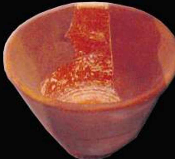
KERAMIK: In Wandersleben wurde diese Terra-Sigillata-Schale gefunden, zu sehen im Weimarer Museum für Ur- und Frühgeschichte. Das Material weist auf einen römischen Import hin.