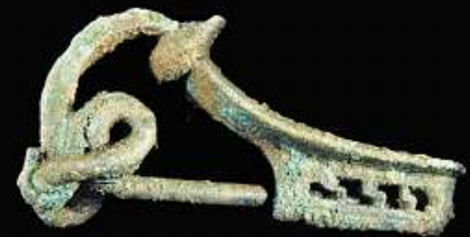
GEWANDSPANGE: Diese Bronzefibel fanden Archäologen vor zwei Jahren in dem reich ausgestatteten Urnengrab einer Germanin aus dem 1. Jahrhundert in Profen (Sachsen-Anhalt).