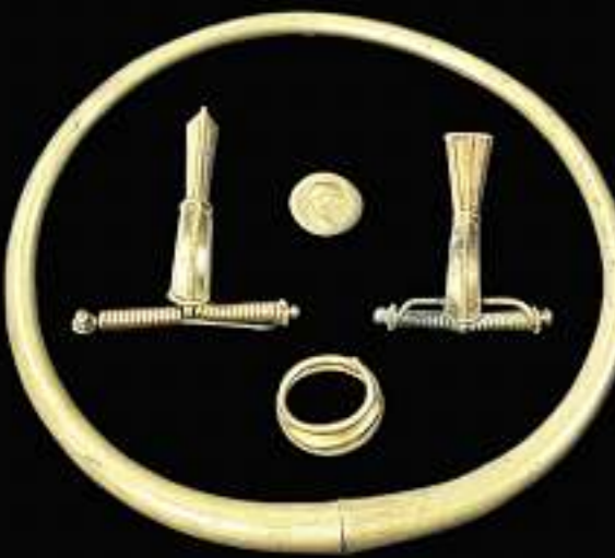
GOLD: Der Germanenfürst aus Gommern bei Magdeburg wurde im 3. Jahrhundert beigesetzt und zählt zum Haßleben-Leuna-Gruppe. Halsreif, Fingerring und Fibeln bestehen aus Gold.