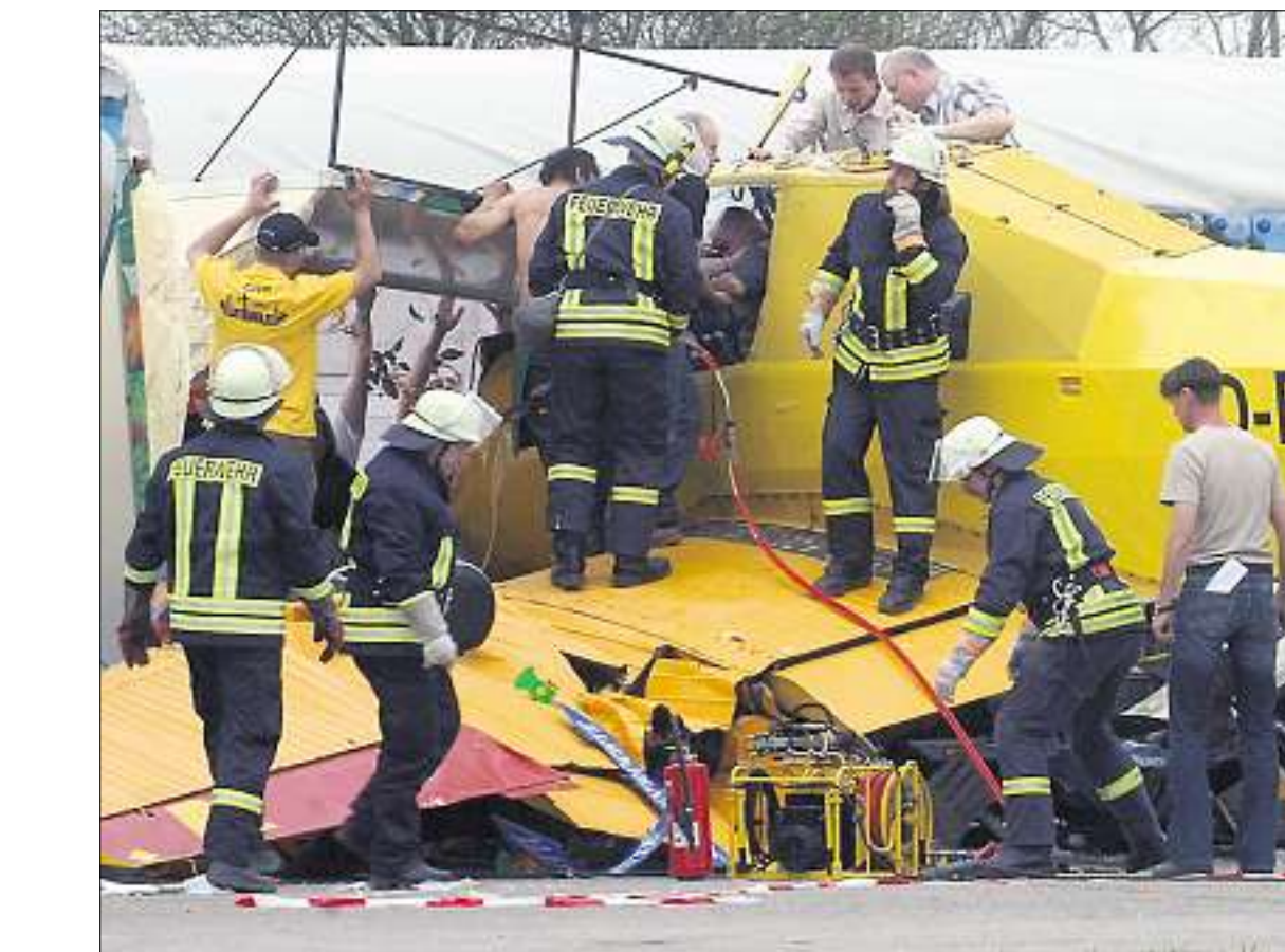
EIN JAHR DANACH: Auf dem Kindel raste ein Flugzeug in Zuschauer, Mitte Mai beginnt der Prozess.

Die Sonne scheint. Menschenmassen strömen zu den Großfluggasttag. Jan L., eigentlich nicht vorgesehen für den Flug, will mit einem Agrarflieger am Nachmittag eine Feuerlöschübung fliegen und am Rande der Startbahn rund 500 Liter Wasser aus dem Flieger ablassen. Doch die Maschine kommt beim Start nach rechts von der Piste ab und rast 350 Meter später in die Zuschauer. Dabei zerstört