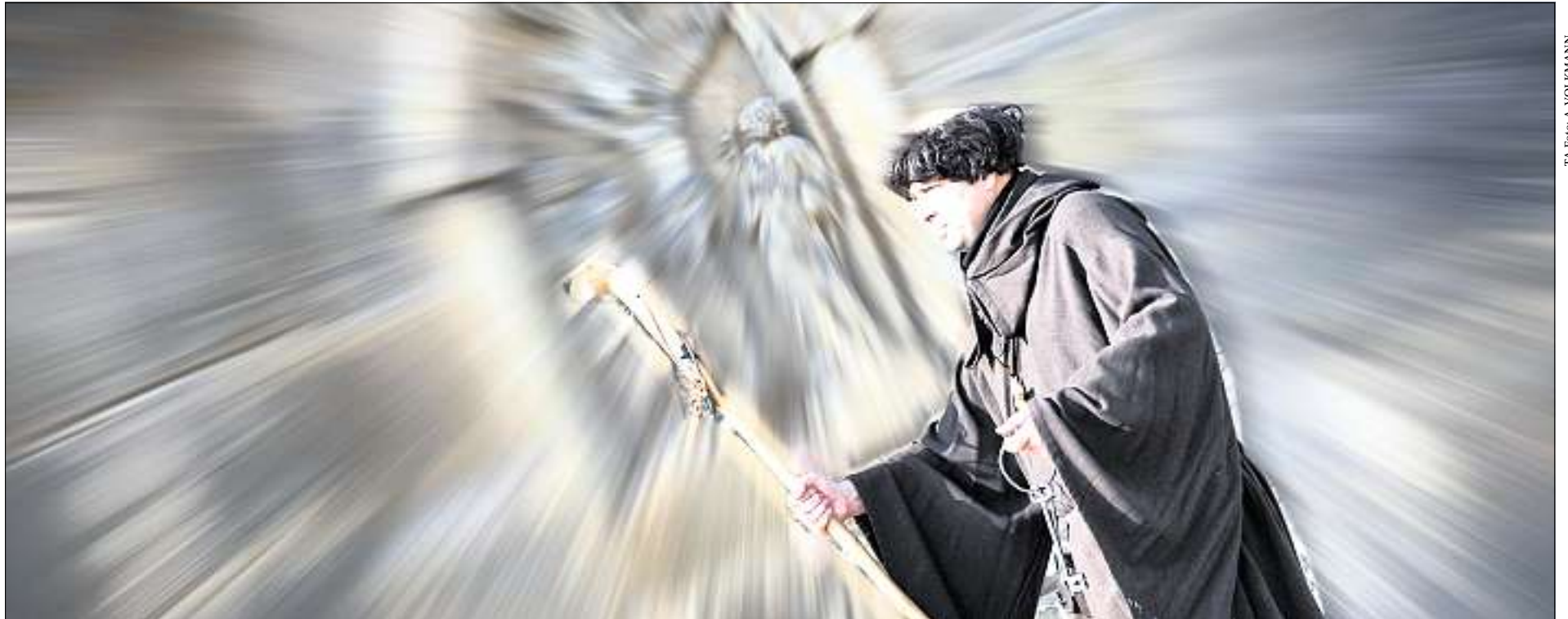
LEGENDE: Im Schötener Grund soll Bonifatius der Legende zufolge mit seinem Hirtenstab an den Felsen geklopft haben – deshalb trägt die Quelle seinen Namen.