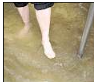
BEKANNT: Die Bonifatius-Quelle im Schötener Grund.

spröden Kalkfelsen erquickliches Quellwasser. Die Not der drei Gesellen hatte ein Ende und die Legende ihren